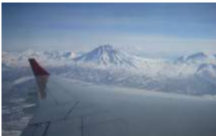
Anflug auf Kamschatka