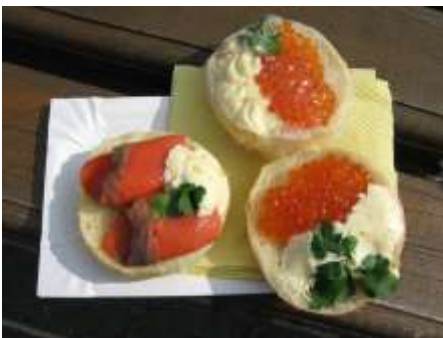
Frischer Fisch und Lachs