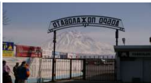
Welcome in Kamschatka