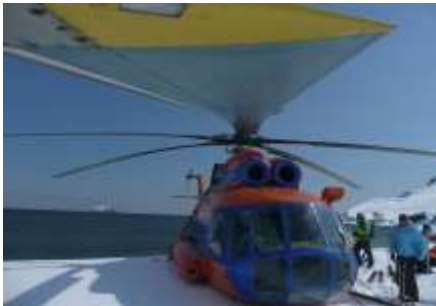
Lunch am Meer