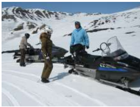
mit dem Skidoo unterwegs