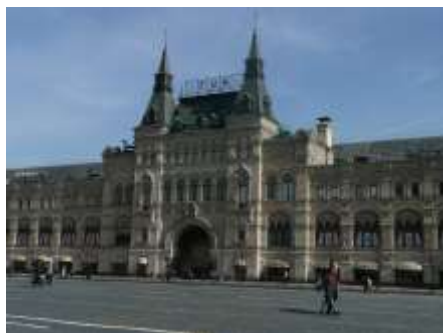
der Rote Platz Kaufhaus GOM