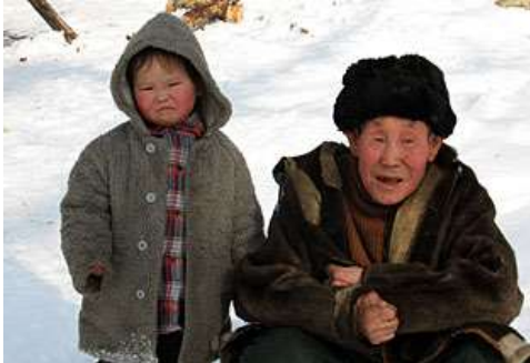
Evenischer Bub mit Opa