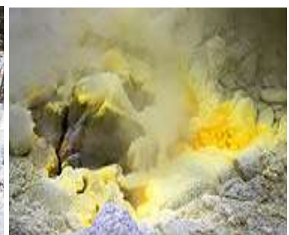
aktiver Vulkan (Schwefel)