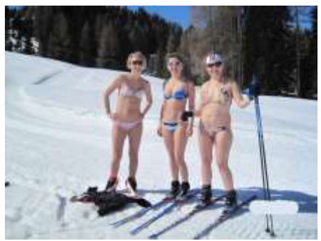
Langlauf in Kamschatka