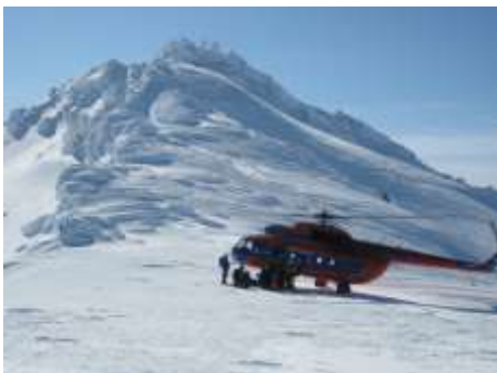
Ausstieg am Gipfel