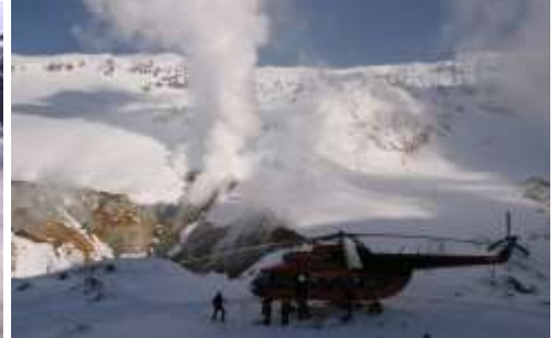
der Berg raucht