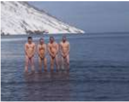
Bad in der Beringsee