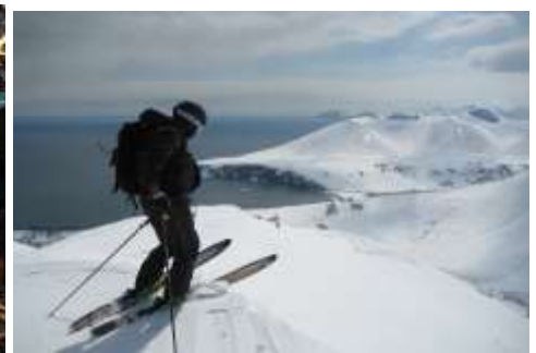
Abfahrt zum Meer