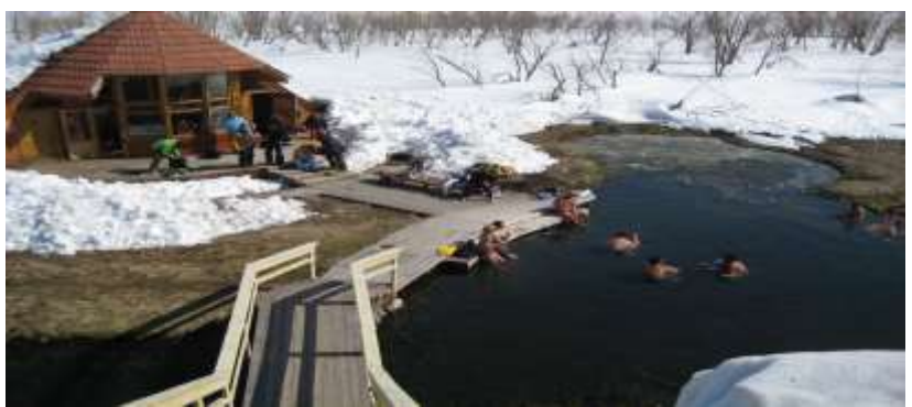
Der Hot Spring nach einen erfolgreichen Powder Tag, das ist die Krönung