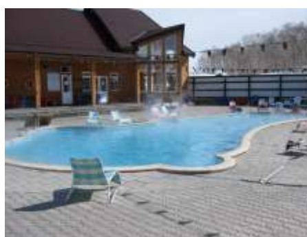
Pool am Hotel