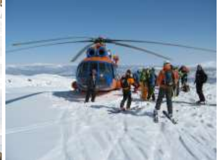
Abholung in der Wildnis