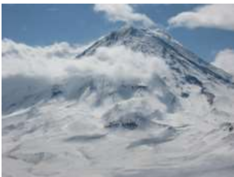
er raucht immer