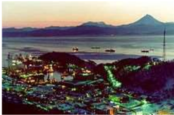
Petropawlowsk ( Hauptstadt von Kamschatka )

Die Oblast Kamschatka und das ganze Kamschatka ist eines der an Natur- und Erholungsressourcen reichsten Länder der Welt. Thermal- und Mineralquellen, Vulkane und Gletscher, das berühmte Geisertal, vielfältige, meistens von der Zivilisation unberührte Pflanzen- und Tierwelt bringen viele Möglichkeiten zur Entwicklung des ökologischen Tourismus auf